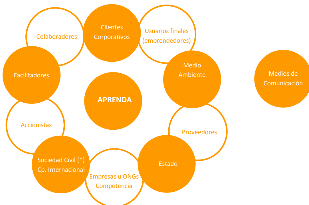
Gráfico 02: Mapeo de Grupos de Interés 7